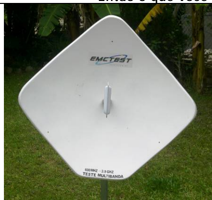
Mod. EMC – DIAMANTE

Então o que você está esperando? Venha já fazer parte desta nova tecnologia!!