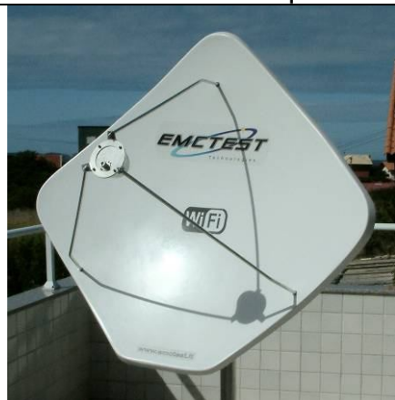
Mod. EMC – DIAMANTE

Então o que você está esperando? Venha já fazer parte desta nova tecnologia!!